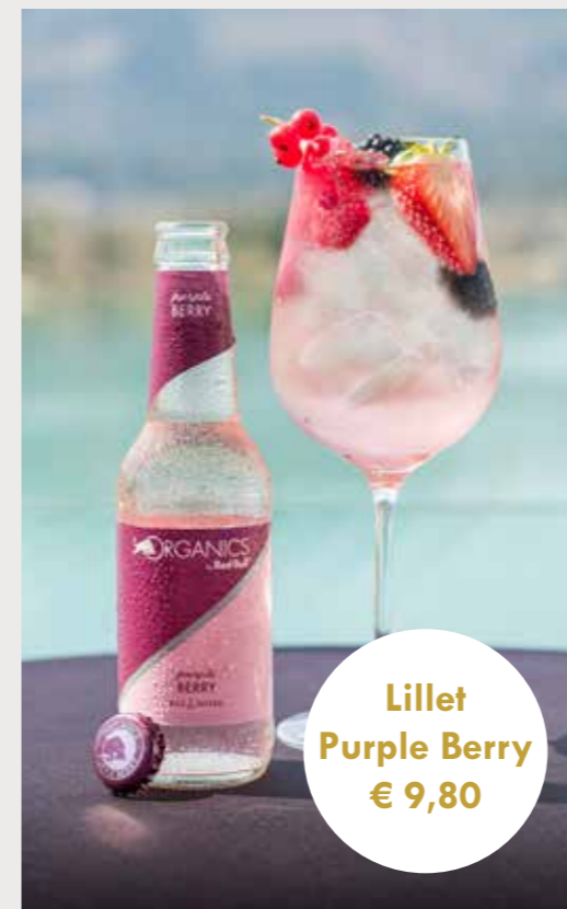
Lillet Purple Berry € 9,80